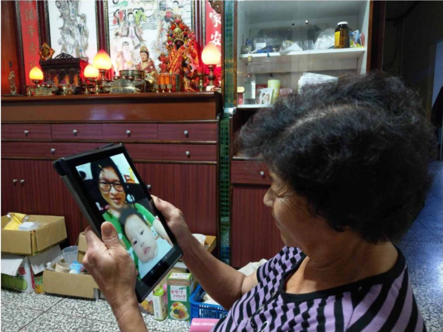
教育部表示，108年已有16縣市84個數位機會中心（DOC）提供服務，偏鄉民眾可到計畫網站( https://itaiwan.moe.gov.tw/tablet/index.php )參考DOC服務據點及借用規則。