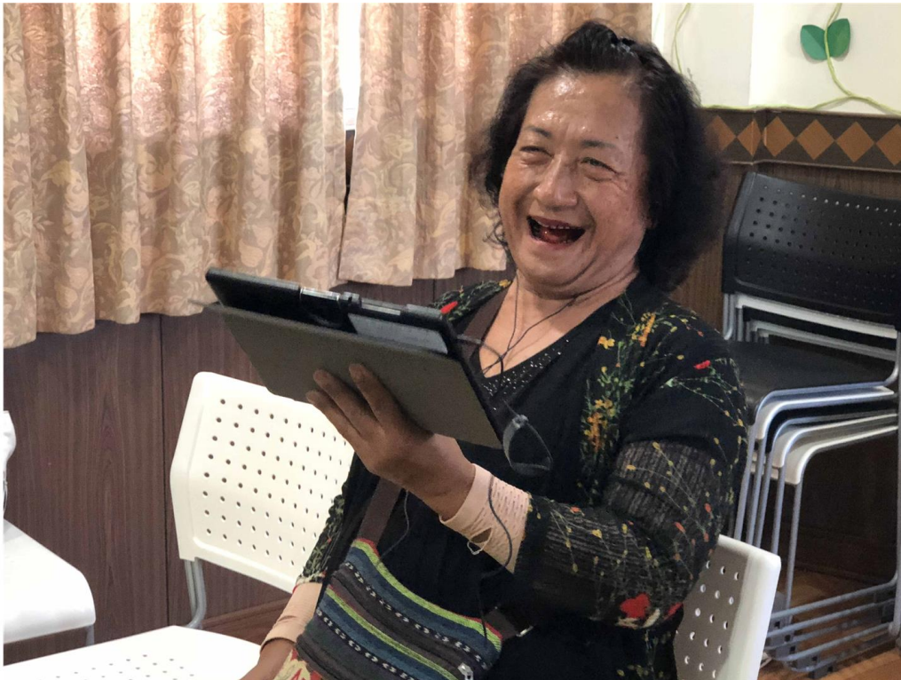
臺東縣大武DOC學員上課學習使用平板電腦，數位開啟新的人生觀。(教育部提供)