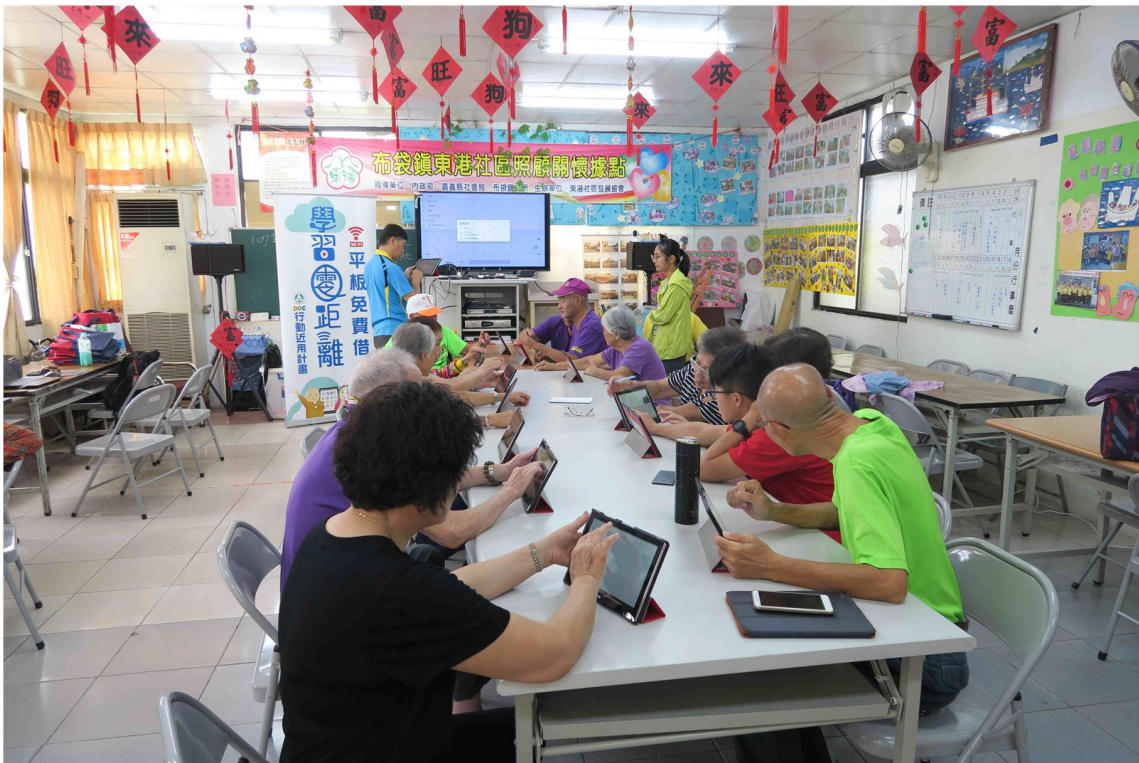
嘉義縣鹿草DOC引導學員運用平板電腦拍照、健康檢測、遊戲等生活應用軟體。(教育部提供)