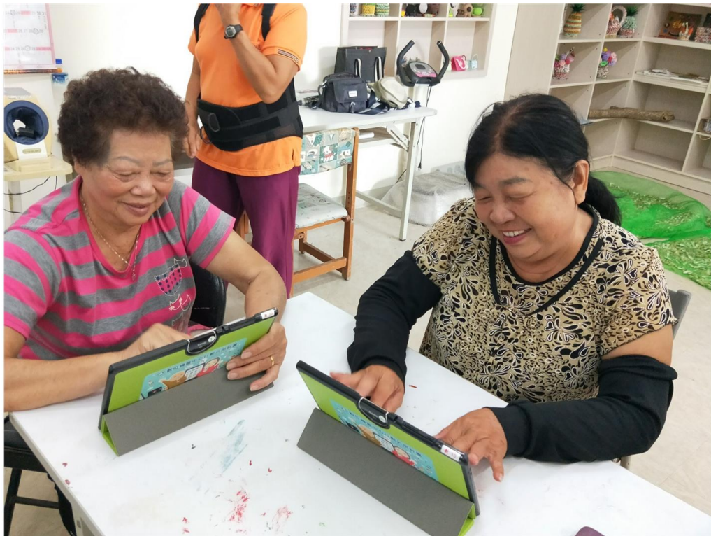
高雄市燕巢DOC教導長者運用平板電腦玩遊戲、卡拉OK唱歌，生活有不同樂趣。