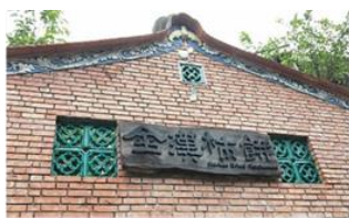
金漢柿餅教育農園

新埔第一間開放參觀教學的柿餅廠，也是傳承三代的柿餅廠。介紹柿的生長、品種加工、生活應用。