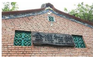
金漢柿餅教育農園

新埔第一間開放參觀教學的柿餅廠，也是傳承三代的柿餅廠。介紹柿的生長、品種加工、生活應用。