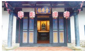
國定古蹟金廣福公館

「金廣福」公館建於清道光 15 年（1835 年），見證了姜秀鑾率眾入墾北埔的起始，由清代保留至今的「大隘地區」辦公及指揮據點。