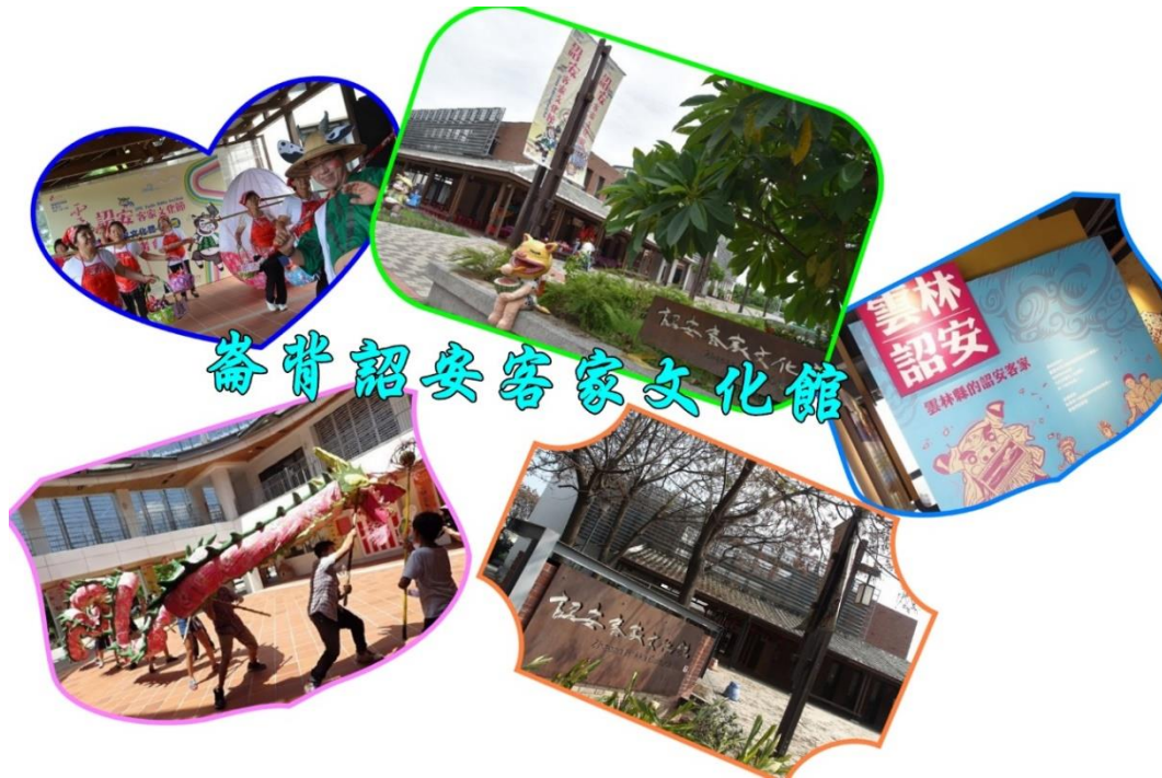
崙背詔安客家文化館

詔安客家文化館，總面積為 8,203 平方公尺（約 2,481 坪），室內空間共有兩層樓，備停車場及戶外廣場。在空間的運用上，常態性之活動置於一樓；二樓則辦理特定性活動，另外動態性的活動則在中庭及戶外廣場辦理。