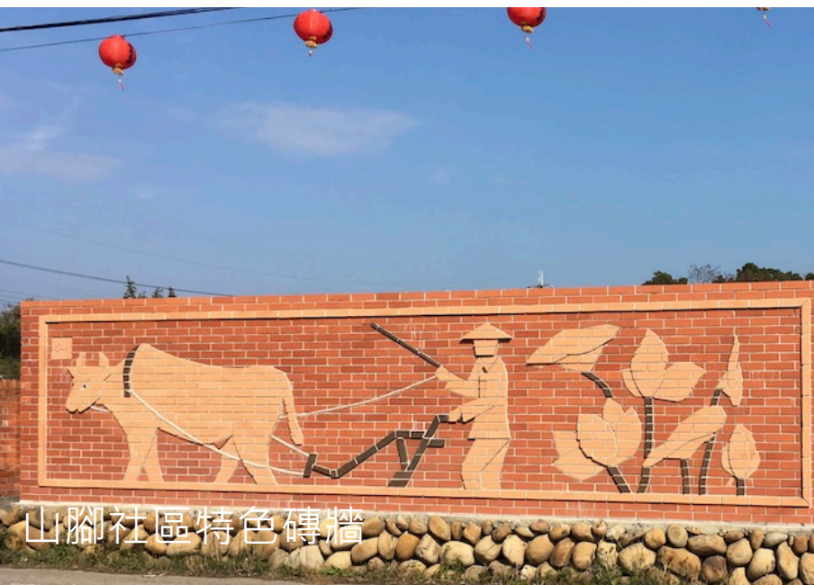
山腳社區特色磚牆