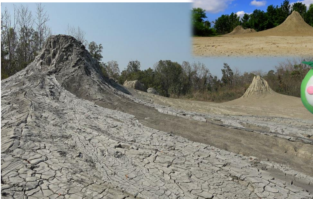
烏山頂泥火山自然保留區

讓我們來趟燕巢自然生態小旅行，除了放鬆身心體會大自然的鬼斧神工，亦學習愛護大自然的情操。