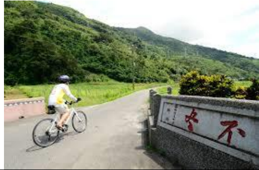
吉安橫斷紀念碑開鑿史