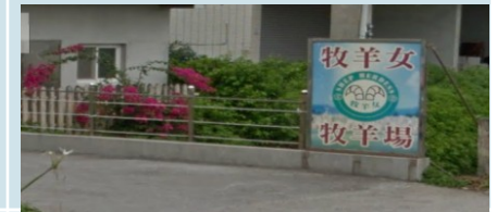
牧羊女親子主題園區

牧羊女親子主題園區結合教育、健康與趣味，是個親子同樂的好去處。另有解說體驗區，可嚐嚐新鮮的羊奶、羊奶冰棒、羊奶冰淇淋等羊乳製品，還設有羊乳生擠區，讓您親自體驗擠羊奶的樂趣，是個教育參觀與親子共遊的好地方。