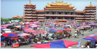
芳苑白馬峰普天宮

位於芳苑的普天宮，主祀天上聖母媽祖，這是橫跨三個世紀的媽祖故事。普天宮中的牆上還有一處浮壁觀音神像，是信徒嘖嘖稱奇的神蹟。