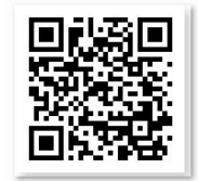
王功地區 360度小導覽